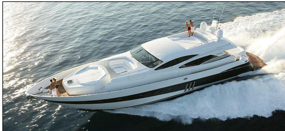
“ Yacht Pershing 90 ”, από Inwardsmarine διαθέσιμο ως κοινό κτήμα